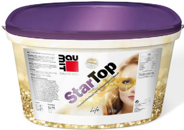
Foto_Baumit_StarTop_01.jpg: Baumit StarTop bietet noch mehr Sicherheit an der Fassade. Durch seine besonderen Oberflächeneigenschaften bleibt die Fassade trockener und sauberer.